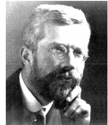
Sir Ronald Aylmer Fisher (1890 – 1962)